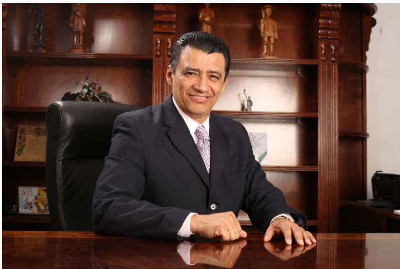
Mtro. José Uriel Estrada Martínez Auditor Superior del Estado

La Revisión y Fiscalización Superior de las Cuentas Públicas, es producto del trabajo conjunto; en ese sentido espero que tu participación se sume al esfuerzo coordinado y te doy la más cordial bienvenida.